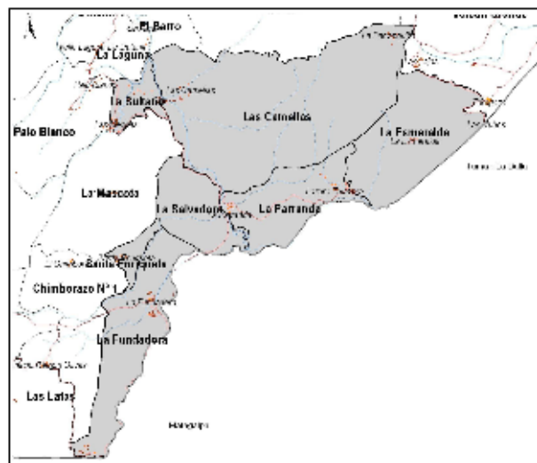
Provincia de Matagalpa y Departamento de Occidente del Estado de Guatemala, Guatemala Mapa de Delimitación Distrital Distrito No. 5 La Fundadora